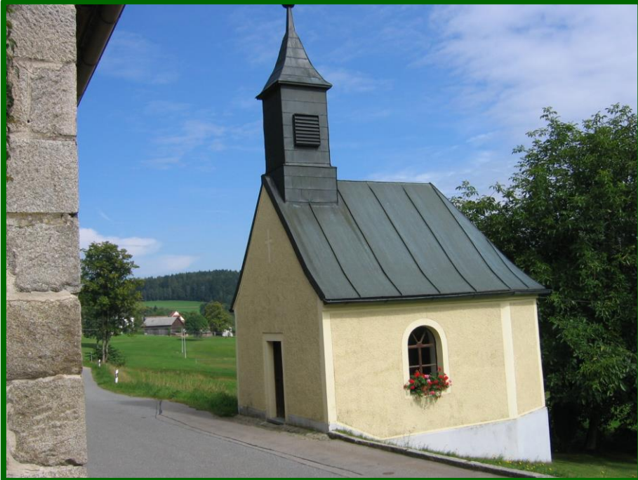
Dorfkapelle Reinhardsrieth Erbaut: 18 85

gehen wir nach ca. 200 m am alten Schulhaus bergab, vorbei am Rotwildgehege. Auf gut markierten Weg, leicht bergan gehen wir in Richtung Berghaus. Nach ca. 400 m auf der Straße nach Flossenbürg gehen wir nach rechts um dann durch einen engen wunderschönen Hohlweg zu wandern. Nach dem Passieren des Nurtschweges, gehen wir auf ebener Strecke durch das „Drei Brunnen“ Waldgebiet, um dann nur noch bergab gehend zum Ausgangspunkt an der Reichenauer Kapelle zu gelangen.