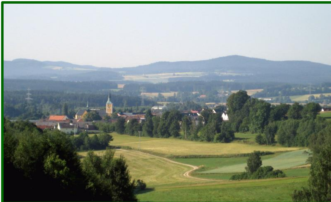
Blick auf Waidhaus