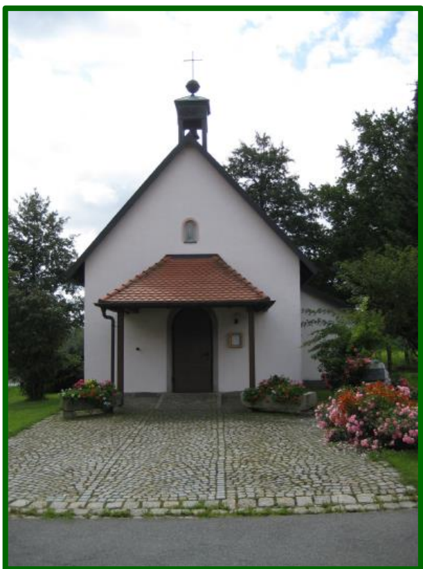
Dorfkapelle „St. Barbara“ Erbaut: 1974

Wir verlassen Waidhaus vom Marktplatz durch die Marienstr. und Brauhausgasse vorbei am Aussiedlerhof über den Steig, Richtung Ödkührieth. Der Markierung folgend, rechtshaltend, gehen wir an Wiesen vorbei, bis wir den Weg durch den Wald nach Hagendorf erreicht haben. Aus dem Wald kommend gehen wir über einen Feldweg zum Dorfweiher (früher mal das „Freibad Hagendorf“). Nach durchqueren des Ortes und entlang der Waidhauser Str. überqueren wir die Str. nach Flossenbürg bis zur Forststr. und folgen der Markierung nach rechts. Nach einigen 100 m biegen wir wieder rechts ab und begeben uns jetzt nur noch bergab gehend an der Freizeitanlage vorbei, links liegend, über die Frankenreuther Str. zum Ausgangspunkt zurück.